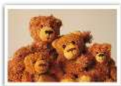
156 THE LUCKY ONES