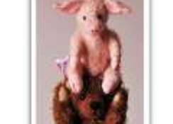
158 GLÜCK AUF!