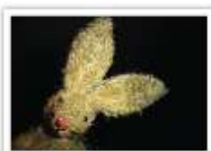
10 BRUNO 2