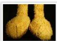
14 DR. HAAS FÜSSE