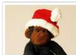
131 SANTA BOZN