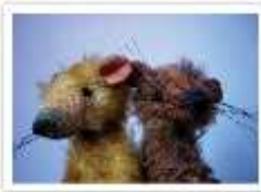
42 RAT PACK