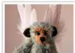
112 ENGEL OLE