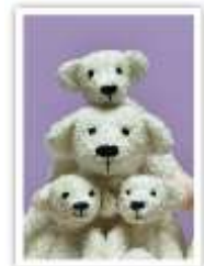
180 ZU VIERT