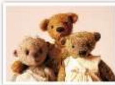
173 DREI GRAZIEN