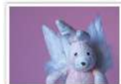
115 ENGEL SOPHIE