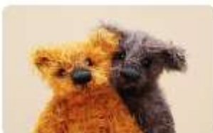
B021 FRED & NORRIS