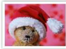
KO15 SANTA ROJO