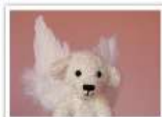
111 ENGEL DAVID