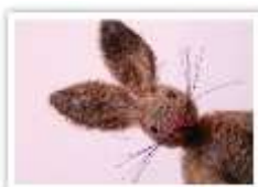
20 BRUNO 3