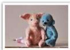
152 LOLA & MO