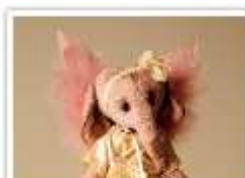
130 ENGEL LUCILE