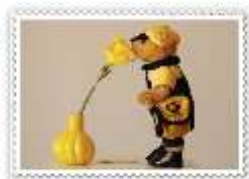
BF001 BRUNO POSTI