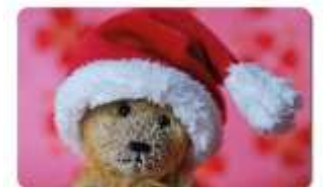
B024 SANTA ROJO