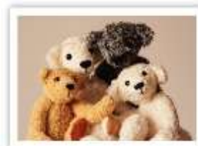
KO11 DIE MENDELS