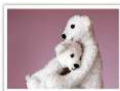
106 DAVID & HANNAH

Postkarten 148 x 104 mm (A6) • 365 g/m 2 • UV-Lackierung • Händler VE 10er Set