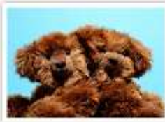
171 FILOU & MAYA