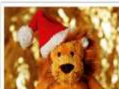
133 SANTA LENNY