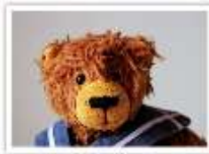
38 TOLSTOI 2