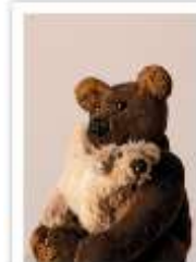
119 EMIL & LONI