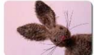
B008 BRUNO 3