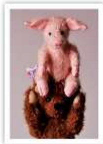
KO25 GLÜCK AUF!