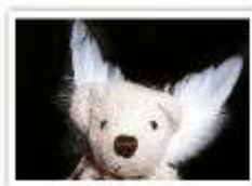
22 ENGEL FELIX