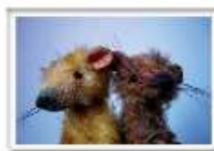
M033 RAT PACK