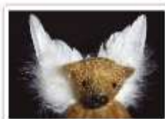
23 ENGEL VINZENZ