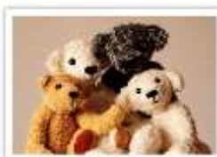
139 DIE MENDELS