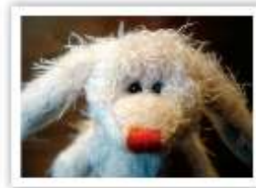
KO23 CARL MOSH