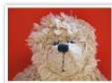
29 MONSIEUR MESMER