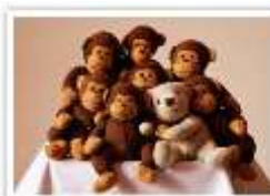
140 FELIX & THE MULLIGANSONS