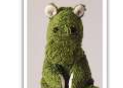
159 LAURENZ 2