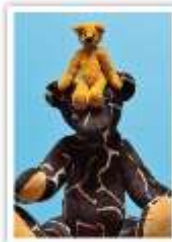
178 SPAß MIT PAPA