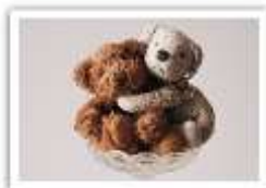
147 PAULCHEN & FELIX