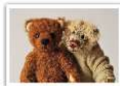
155 FRIDOLIN & CARLO