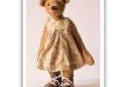
157 LOTTA 2