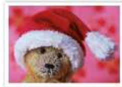
45 SANTA ROJO