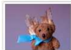
114 ENGEL PIERRE