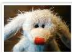
17 CARL MOSH