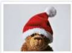
47 SANTA AUGUSTE