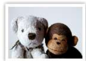
KO12 FELIX & MULLIGAN