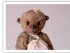
169 MA PETITE