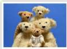
176 STOLZE GROßELTERN