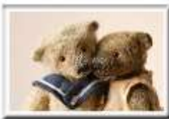
M032 CLEMENS & LILI