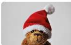
B023 SANTA AUGUSTE