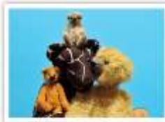
177 EN FAMILLE