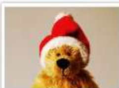
132 SANTA ALIOSCHA