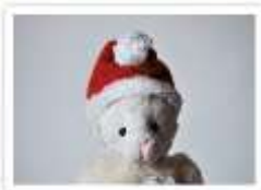
46 SANTA ARTHUR