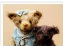
138 SUZE & NORRIS