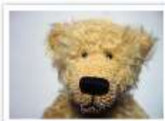
15 GASTON 2