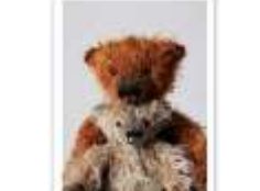
67 GREGORI & LUCA