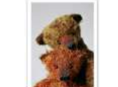
69 MAX & GREGORI