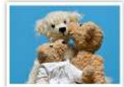
175 ZU DRITT