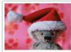
44 SANTA HORATIO