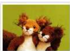
136 SAM & DAVE

Postkarten 148 x 104 mm (A6) • 365 g/m 2 • UV-Lackierung • Händler VE 10er Set