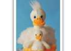
160 GANS KLEIN