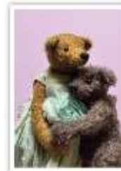
179 LOTTA & NORRIS