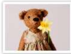
168 LOTTA IM FRÜHLING