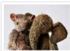
63 AMADEUS & CLAUDIUS