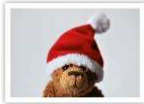
KO13 SANTA AUGUSTE