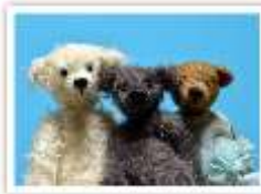
172 DREI FREUNDE