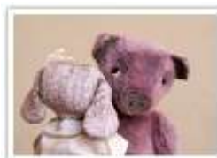
110 LUCILE & LARS