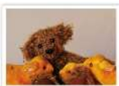
66 LEONS FREUNDINNEN