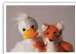
150 GANS NAH