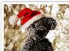
134 SANTA PAULE