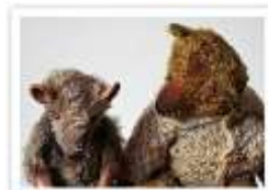
65 AMADEUS & MAX