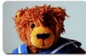
B003 TOLSTOI 2